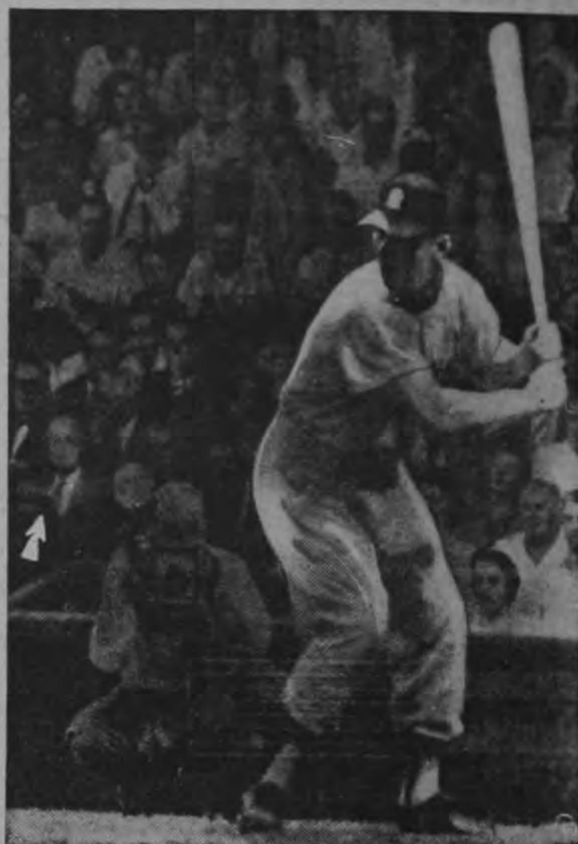
El Presidente Eisenhower (flecha) contempla al bateador de los Yankees Mickey Mantle en acción en el séptimo inning del juego con los Senadores en el estadio Griffith, en Washington. El Presidente no tuvo que esperar mucho para ver a Mantle batear su home-run número 47 de la temporada. Necesita 13 más este mes para igualar el record establecido por Babe Ruth.

EL DAÑO DEL ALCOHOL LO HEREDAN LOS HIJOS, LOS NIETOS LOS BISNIETOS, LA DESCENDENCIA TODA. COMISION SOBRE ALCOHOLISMO