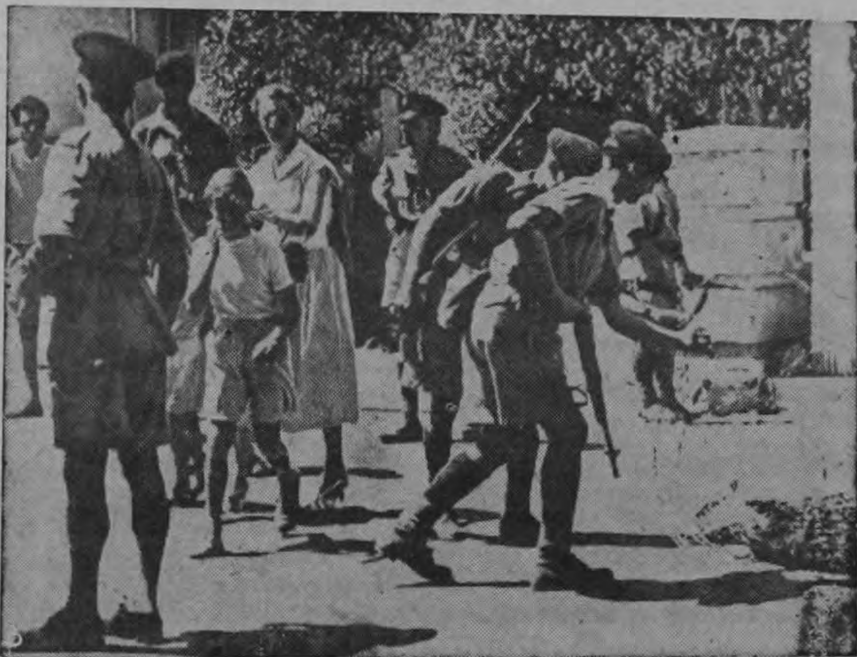
Una mujer inglesa y un niño aparecen pasando por el cordón de tropas armadas establecido en torno al Hospital Civil de Nicosia, en Chipre, después que el hospital se convirtió en escenario de un tiroteo entre los soldados británicos y los terroristas chipriotas.